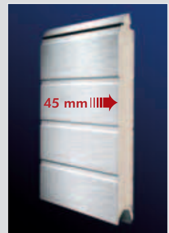
Schnittansicht Sektion Typ SST 45 – doppelwandig, isoliert mit 45 mm FCKW-freiem PUR-Hartschaumkern.